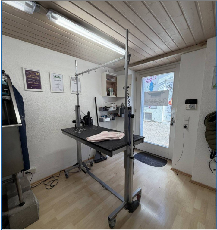
Büro/ Laden Fläche