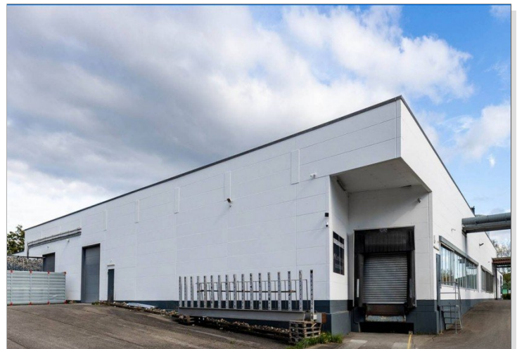
Rampe für LKW_nah