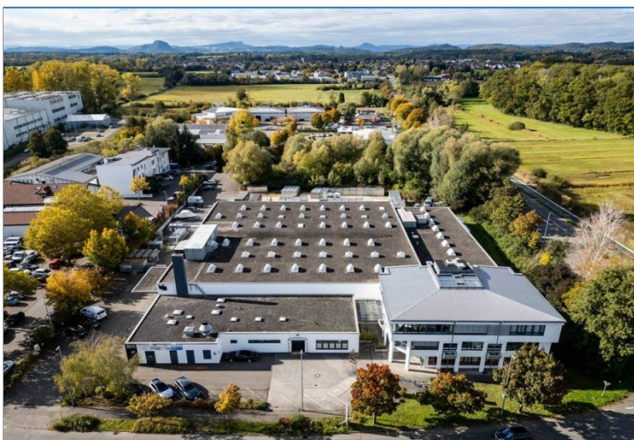
Luftbild mit Ansicht von Straße