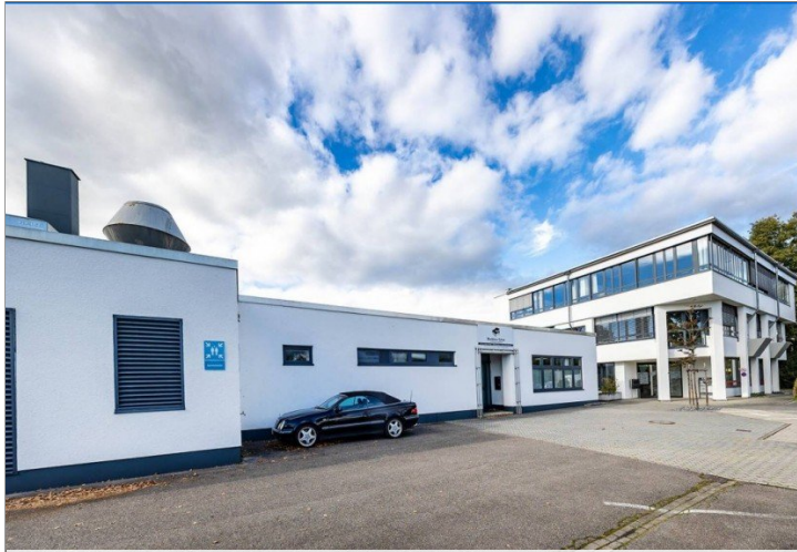
Vorderseite Blick von den Parkplätzen