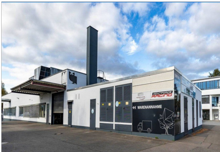
Halle linke Seite mit großer Torzufahrt