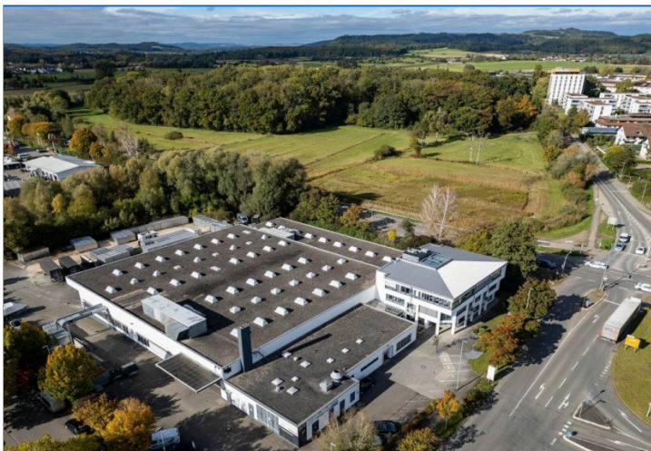
Luftbild mit Ansicht der Zugangsstraßen