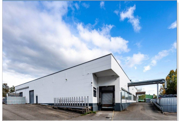
Rampe für LKW