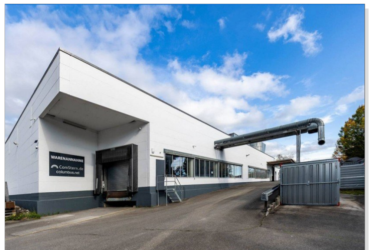
Rampe und seitliche Fensterfront